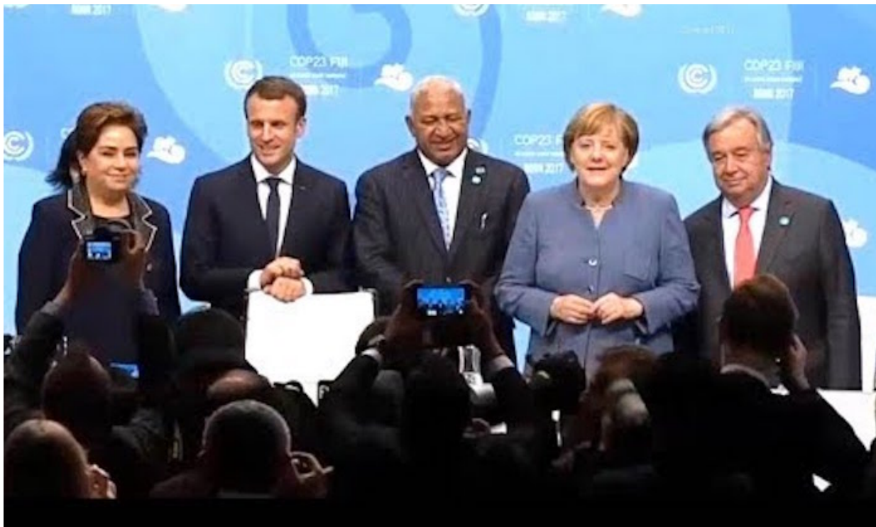
Emmanuel Macron et Angela Merkel à Bonn, lors de la COP23.

l'Iddri (Institut du développement durable et des relations internationales). Or, ces discussions devaient plutôt porter sur la mise en œuvre de l'Accord de Paris, avec la définition de règles communes pour, par exemple, comptabiliser les efforts de chaque pays de réduction de ses émissions de gaz à effet de serre, ou encore les moyens apportés à la lutte contre le changement climatique. Les négociations n'ont « pas autant avancé qu'on l'aurait espéré. Cela laisse beaucoup de travail pour l'an prochain », explique le chercheur. Une situation qu'il estime due à un « manque de leadership gouvernemental. C'est très bien que Angela Merkel et Emmanuel Macron soient venus, notamment parce que le leadership européen pourrait combler la perte de celui des États-Unis. »