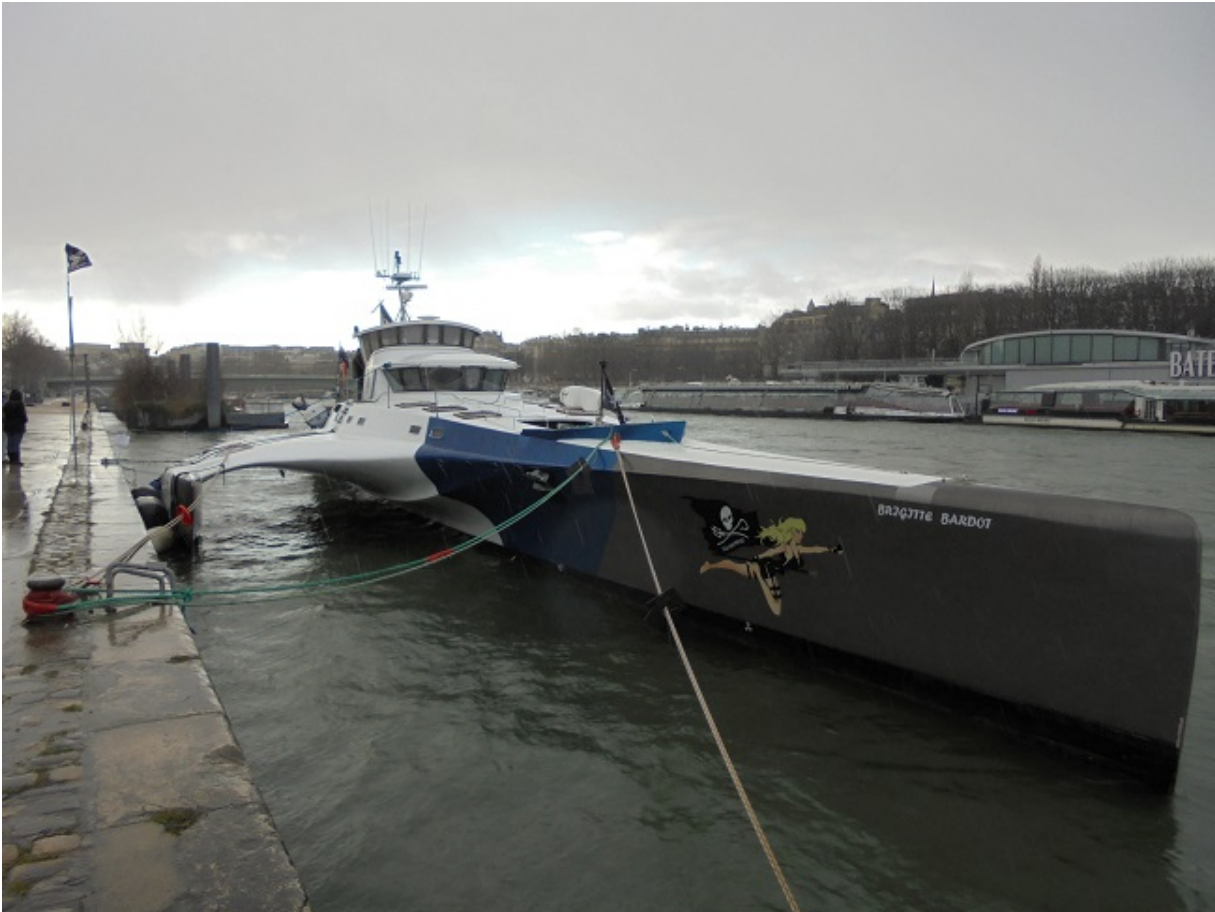
Le bateau de Sea Sheperd sur la Seine