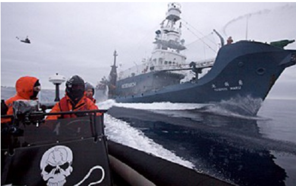
Un zodiac de Sea Sheperd en action

Cela fait 82 jours [au 11 mars] qu'un de nos bateaux, le Bob Barker, poursuit un braconnier, le Thunder. Ce navire braconne de la légine australe et figure sur la liste mauve d'Interpol pour pêche illégale. L'affaire est en cours d'instruction. Notre second bateau sur cette campagne, le Sam Simon, a confisqué leurs filets et les a donnés à Interpol sur l'île Maurice. C'est la plus longue poursuite qui ait jamais été menée contre un braconnier. Il ne sait plus où aller car nous le suivons en permanence et nous dénonçons sa position aux autorités.