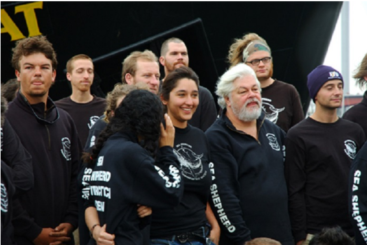
Paul Watson avec l'équipage du Farley Mowat en 2005

est en charge des questions climatiques ! La droite américaine est tout simplement composée de fanatiques religieux idiots. On ne peut pas parler rationnellement avec ces gens-là.